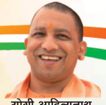
योगी आदित्यनाथ मा. मुख्यमंत्री, उत्तर प्रदेश